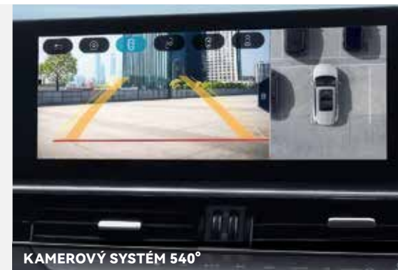
KAMEROVÝ SYSTÉM 540°