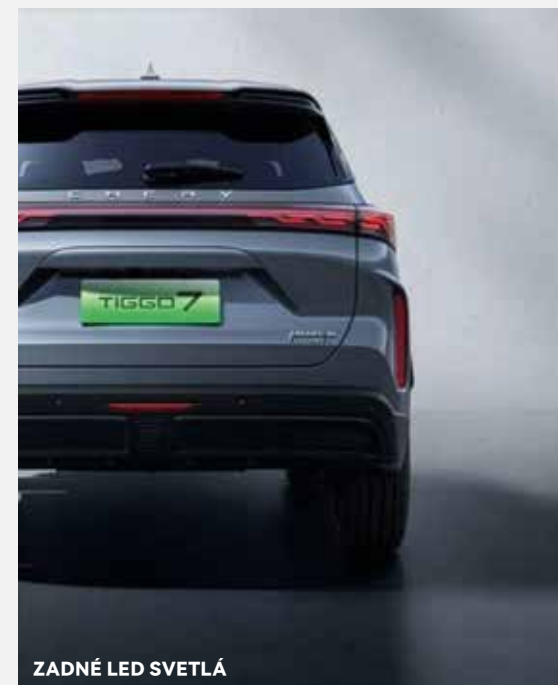
ZADNÉ LED SVETLÁ