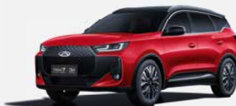
PRIME RED (ZF) – ČIERNÁ STRECHA