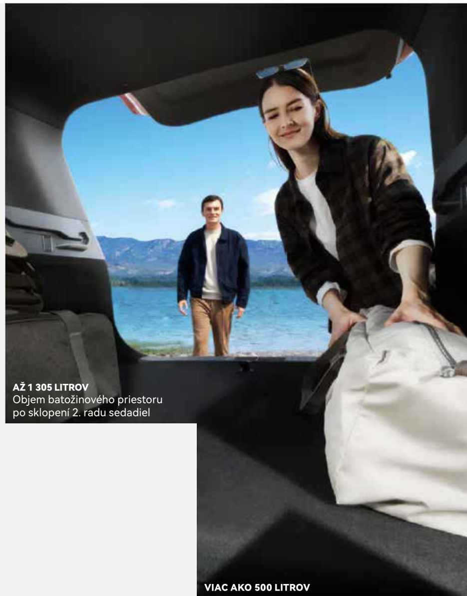
AŽ 1 305 LITROV Objem batožinového priestoru po sklopení 2. radu sedadiel

Batožinový priestor s objemom 500 litrov možno po sklopení zadných sedadiel zväčšiť na približne 1 300 litrov, čo zaručuje veľkú univerzálnosť pri preprave nákladu.