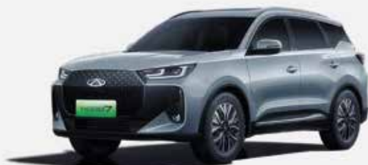
TECH GRAY (GX)