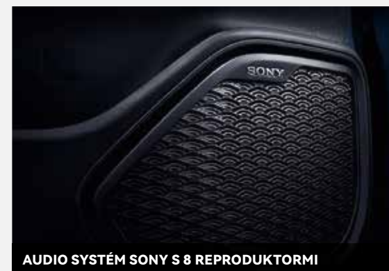
AUDIO SYSTÉM SONY S 8 REPRODUKTORMI