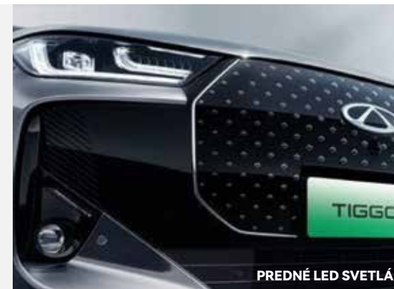
PREDNÉ LED SVETLÁ

Viacprvkové zavesenie, známe z prémiového segmentu, zaručuje výnimočnú stabilitu, presné riadenie a väčší komfort pri jazde bez ohľadu na podmienky na ceste. V kombinácii s hybridným pohonom vytvára dokonalú rovnováhu medzi výkonom a pohodlím. Nie je to len technológia – je to pozvánka na úplne novú úroveň radosti z jazdy.