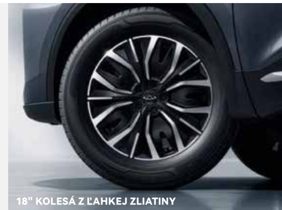
18" KOLESÁ Z ĽAHKEJ ZLIATINY