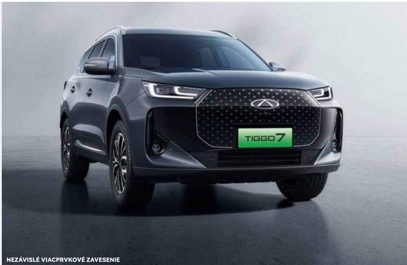
NEZÁVISLÉ VIACPRVKOVÉ ZAVESENIE