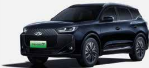
CARBON CRYSTAL BLACK (CL)