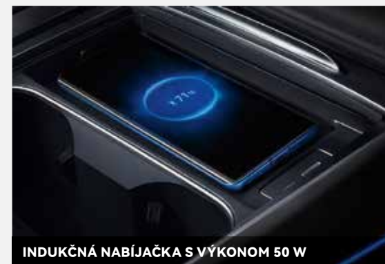
INDUKČNÁ NABIJAČKA S VÝKONOM 50 W