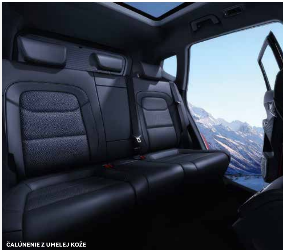
ČALÚNENIE Z UMELEJ KOŽE