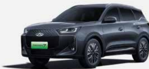
PHANTOM GRAY (GV)