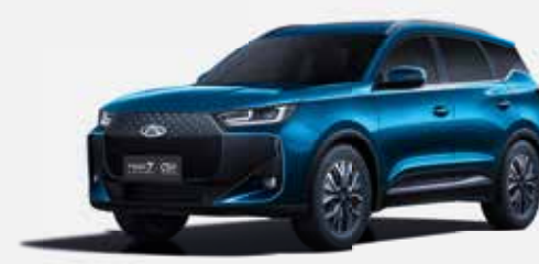
EMERALD BLUE (WE)