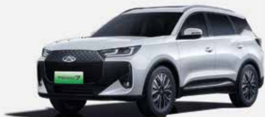
KHAKI WHITE (BW)