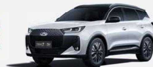
KHAKI WHITE (ZE) – ČIERNÁ STRECHA