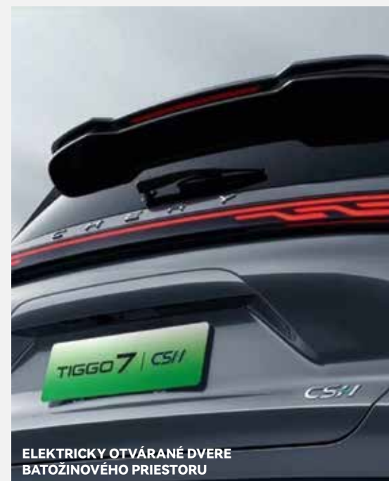
ELEKTRICKY OTVÁRANÉ DVERE BATOŽINOVÉHO PRIESTORU