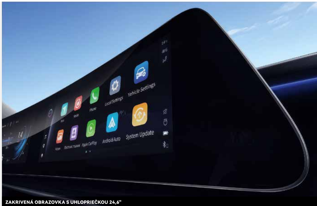
ZAKRIVENÁ OBRAZOVKA S UHLOPRIEČKOU 24,6"

Procesor Snapdragon 8155 zaručuje výnimočný výkon a plynulosť multimediálneho systému. Vďaka nemu sa systém spustí za menej ako 2 sekundy a dokáže spracovať viac ako 20 príkazov za 30 sekúnd.