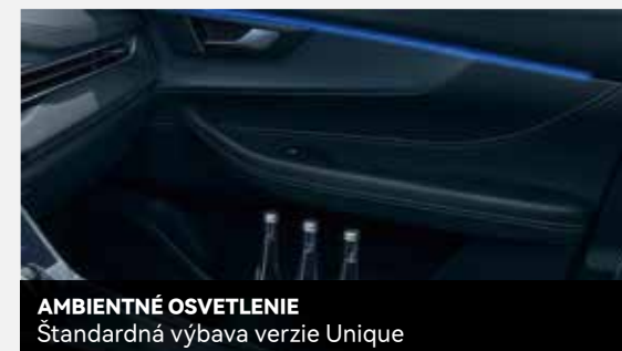
AMBIENTNÉ OSVETLENIE Štandardná výbava verzie Unique