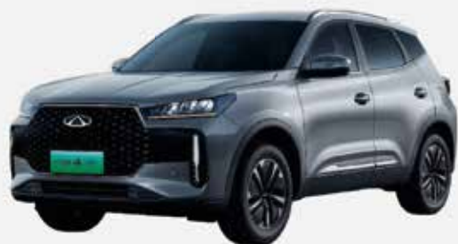
TECH GRAY (GX)