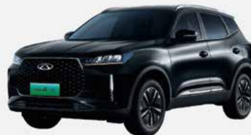
CARBON CRYSTAL BLACK (CL)