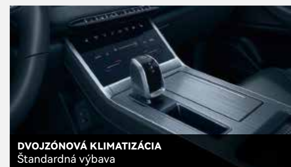
DVOJZÓNOVÁ KLIMATIZÁCIA Štandardná výbava