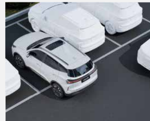
SYSTÉM VAROVANIA PRED KOLÍZIOU PRI CÚVANÍ (RCW)

ADAS systémy sú súčasťou stratégie značky v oblasti bezpečnosti a moderných technológií. CHERY ako výrobca, ktorý vyvíja vlastné riešenia v oblasti autonómie a umelej inteligencie, ponúka čoraz pokročilejšie asistenčné systémy vodiča.