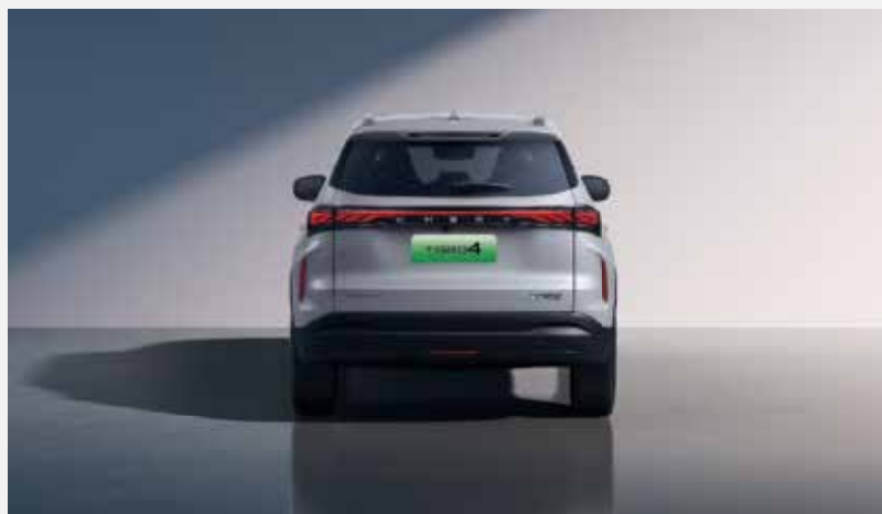
Celková šírka so zrkadlami: 1 831 mm, celková výška: 1 652 mm