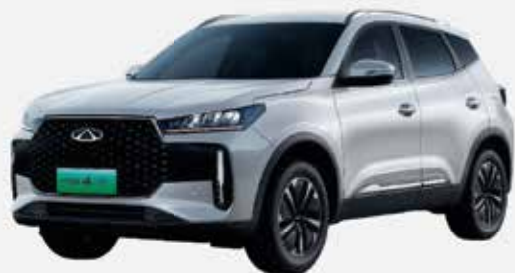
KHAKI WHITE (BW)