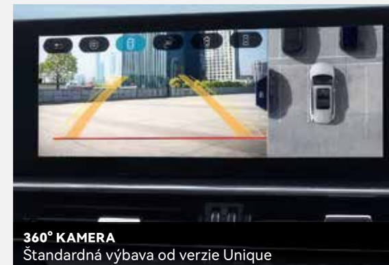
360° KAMERA Štandardná výbava od verzie Unique