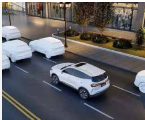
ADAPTÍVNY TEMPOMAT S FUNKCIOU UDRŽIAVANIA V JAZDNOM PRUHU (ACC)