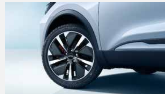
17" KOLESÁ Z ĽAHKEJ ZLIATINY Štandardná výbava