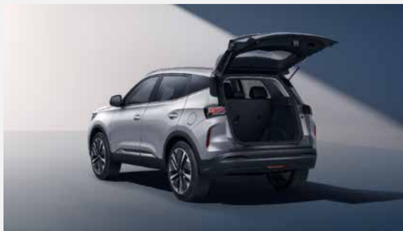
Objem batožinového priestoru: 430 l (so sklopenými sedadlami: 1 190 l)