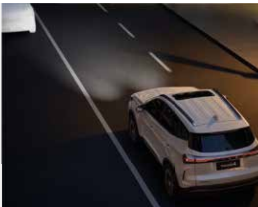
INTELENTNÉ OVLÁDANIE SVETLOMETOV (IHC)