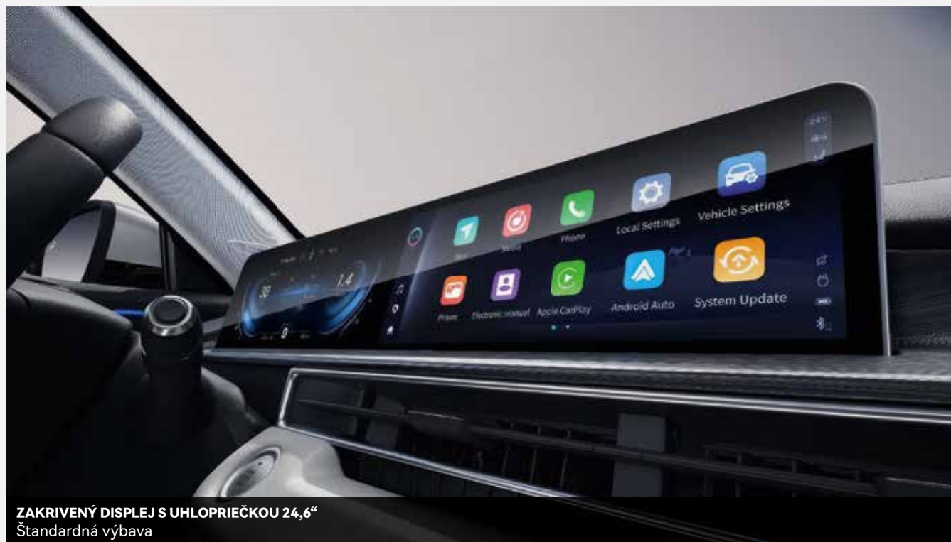
ZAKRIVENÝ DISPLEJ S UHLOPRIEČKOU 24,6" Štandardná výbava