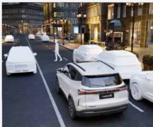
SYSTÉM NÚDZOVÉHO BRZDENIA (EBA)