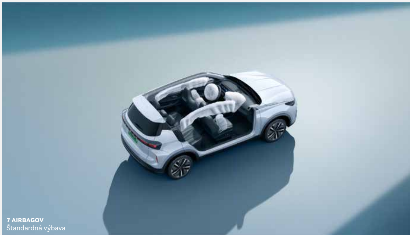
7 AIRBAGOV Štandardná výbava