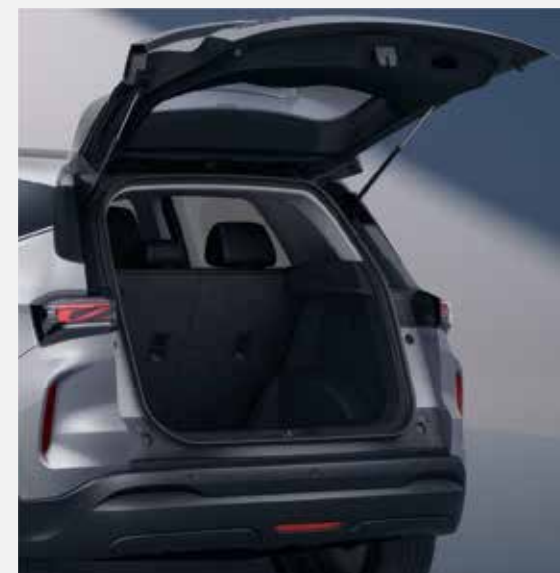
OBJEM BATOŽINOVÉHO PRIESTORU JE 340 LITROV, PO SKLOPENÍ ZADNÝCH SEDADIEL SA ZVÝŠÍ AŽ NA 1 190 LITROV.