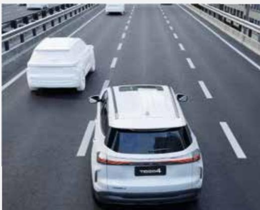
SYSTÉM VAROVANIA PRED NEÚMYSELNOU ZMENOU JAZDNÉHO PRUHU (LDW)