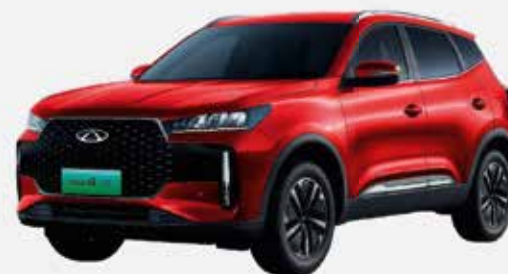
PRIME RED (NL)