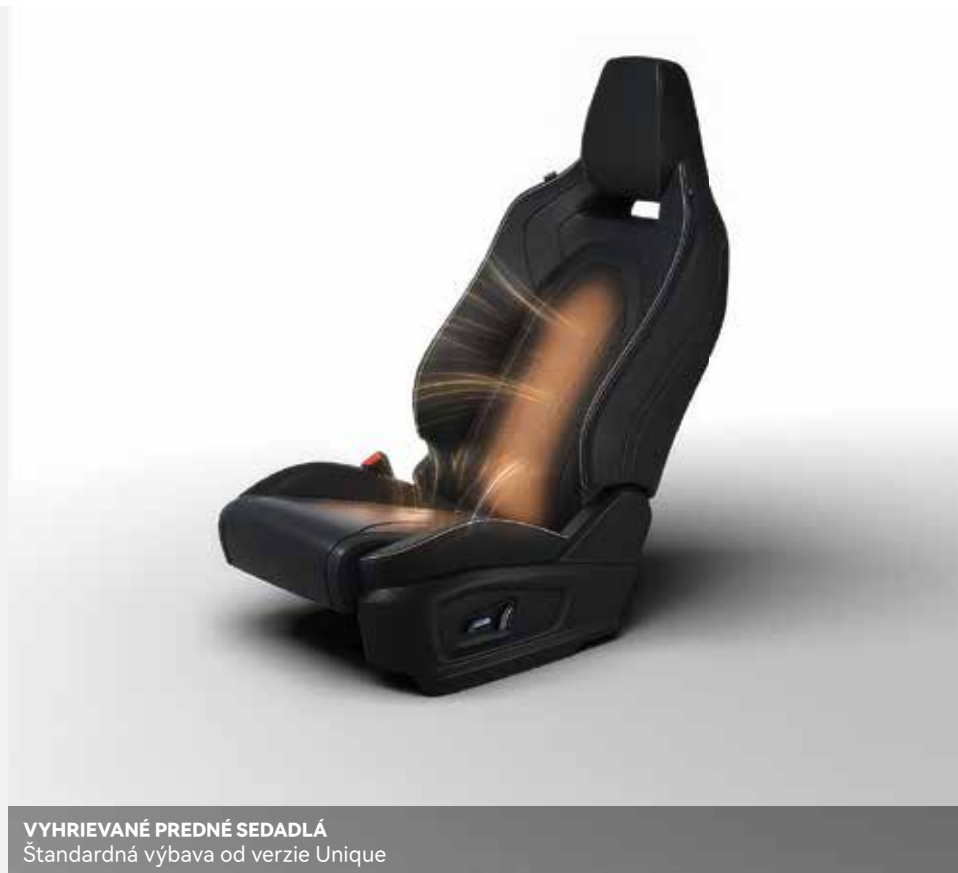
VYHRIEVANÉ PREDNÉ SEDADLÁ Štandardná výbava od verzie Unique