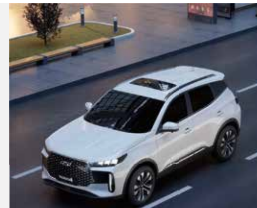
SYSTÉM MONITOROVANIA MŔTVEHO UHLA V ZRKADLÁCH (BSD)