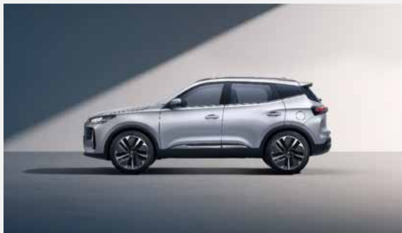
Celková dĺžka: 4 320 mm, rázvor náprav: 2 610 mm